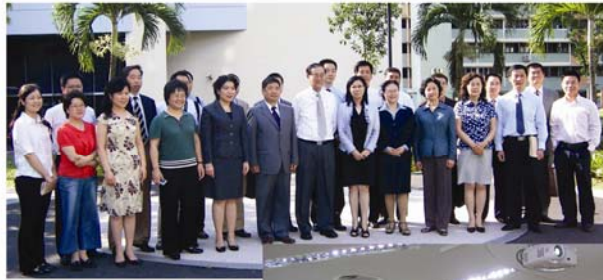
中国中央国家 机关工委 培训团拜访 新加坡人民 行动党总部