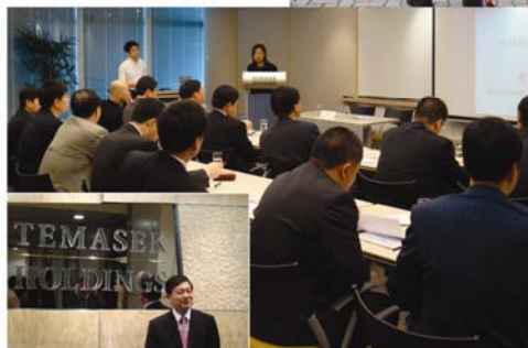
中央国资委培训考察团 拜访新加坡淡马锡 控股公司