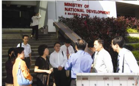
中国国家人事部培训团 拜访新加坡国家发展部