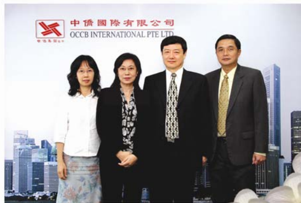
公司 管理 层 成 员