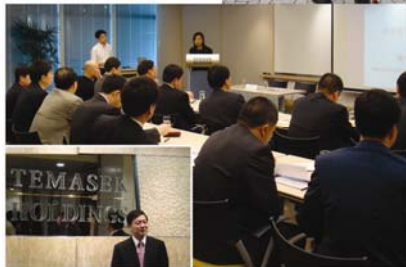
中央国资委培训考察团 拜访新加坡淡马锡 控股公司