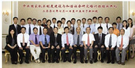
中国中央机关工委培训团结业典礼合影留念