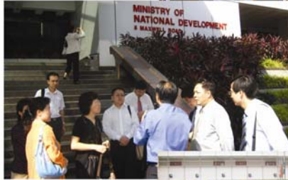
中国国家人事部培训团 拜访新加坡国家发展部