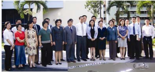
中国中央国家机关工委 培训团拜访 新加坡人民 行动党总部